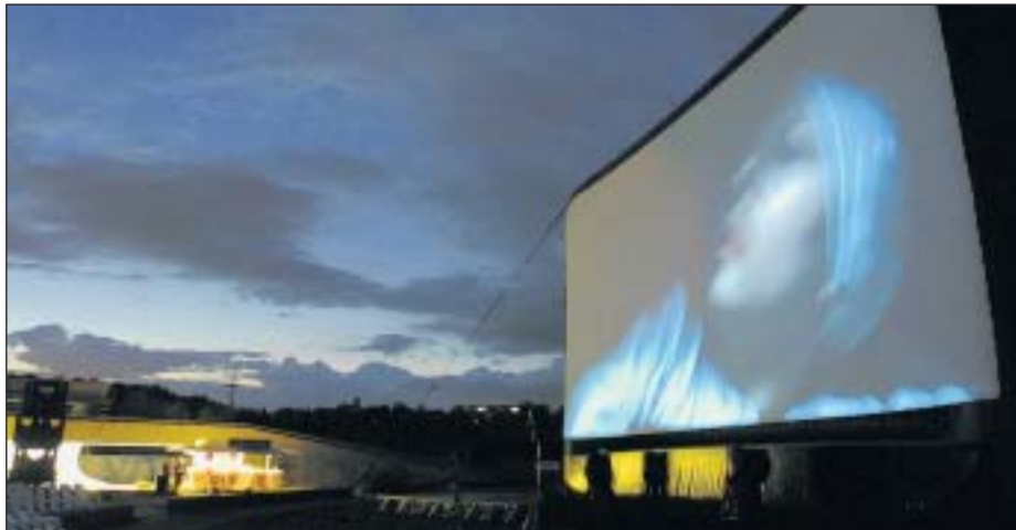
Tolle Atmosphäre: Am Donnerstag startet das Open Air im Kieswerk mit Filmen und Musik.